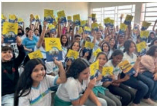
Gurjão - Paraíba