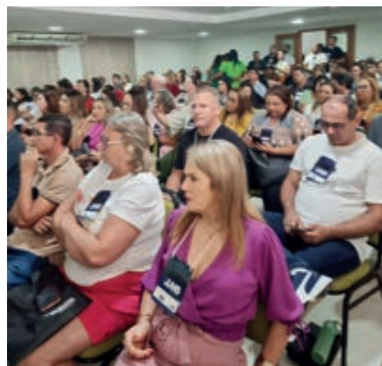
João Pessoa - PB