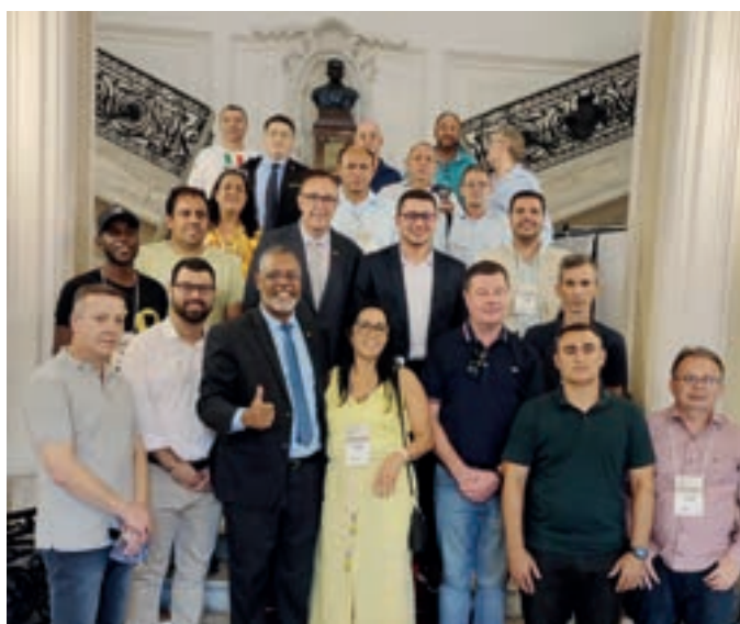
Visita técnica na Câmara Municipal do Rio de Janeiro

No final de novembro aconteceu o Encontro Nacional de Gestores e Legislativos no Rio de Janeiro/RJ, o evento teve a participação de vereadores, vereadoras, assessores e servidores de câmaras municipais de vários estados.