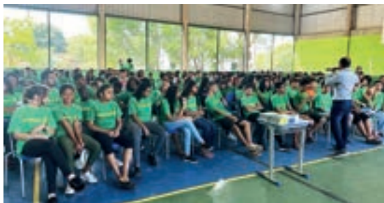
Três Lagoas - Mato Grosso do Sul