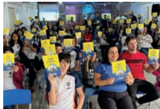
Cuité - Paraíba