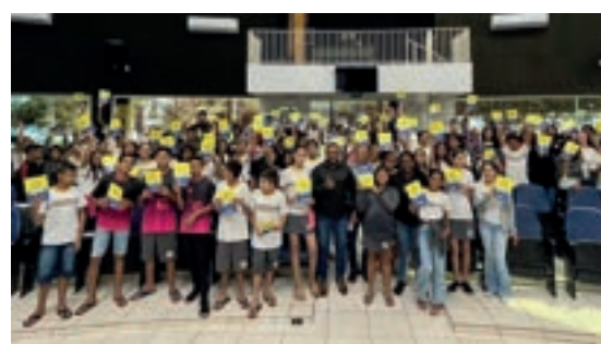
Campo Novo do Parecis - Mato Grosso