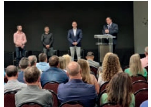
Eleição da diretoria da UVB