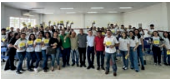
General Sampaio - Ceará