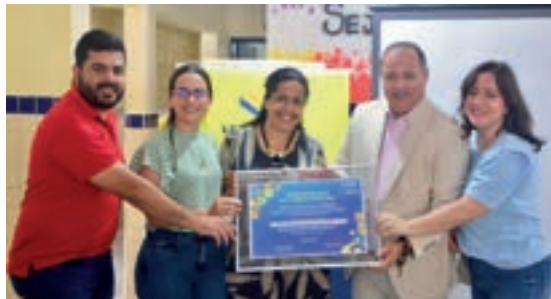
Bonito - Pernambuco