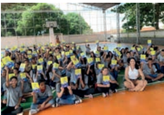
Cristais Paulista - São Paulo