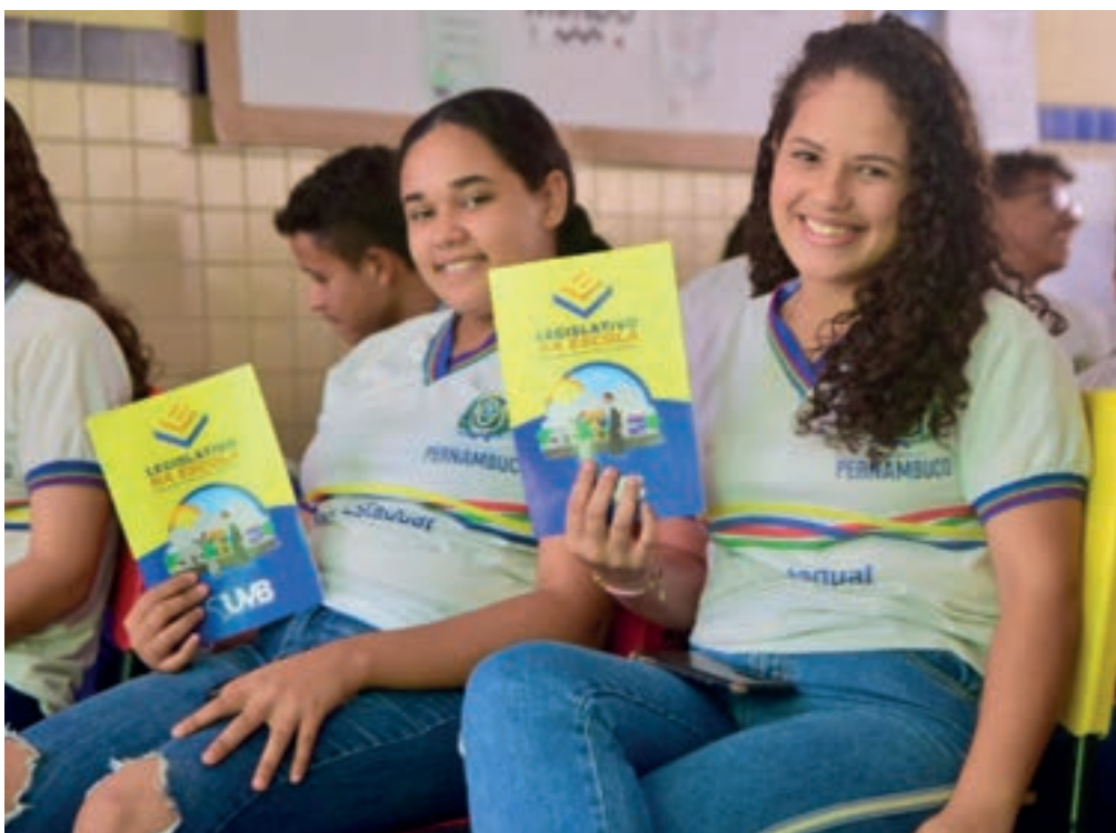
Legislativo na Escola chega a 15 Estados

Portanto, a XXIII Marcha dos Legislativos Municipais representa uma oportunidade ímpar para fortalecermos a democracia local, integrar os representantes municipais e capacitar os vereadores e vereadoras para exercerem seus mandatos com excelência e comprometimento com o bem-estar das comunidades que representam.