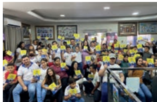
Coronel João Pessoa - Rio Grande do Norte