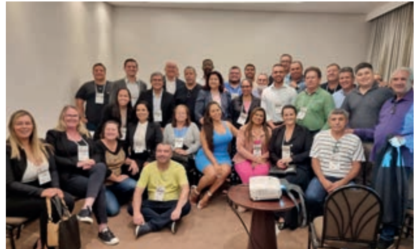
A UVB tem muitos vereadores engajados com a causa animal