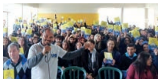
Almirante Tamandaré - Paraná