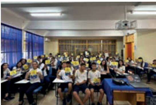
Acreuna - Goiás