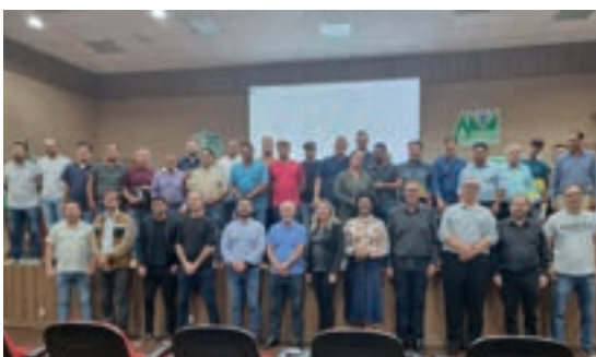
Francisco Beltrão - PR