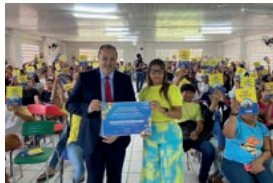
Barra de Guabiraba - Pernambuco