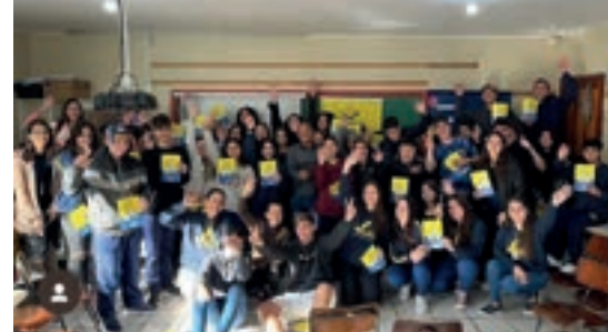
Coronel Vivida - Paraná