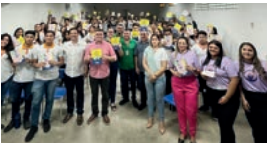
Pentecoste - Ceará