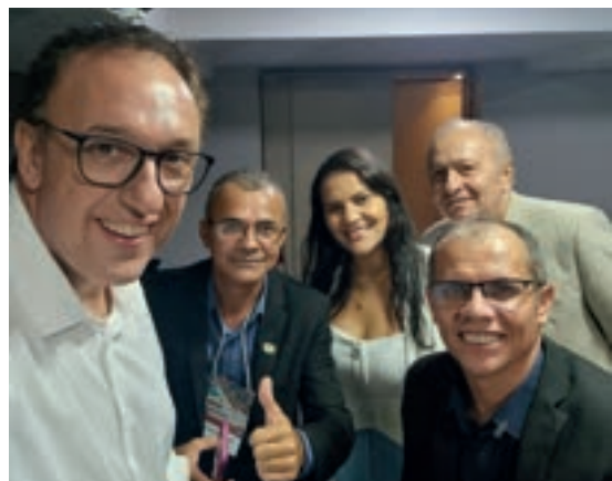
Junto com a UVB-PB no Estado da Paraíba