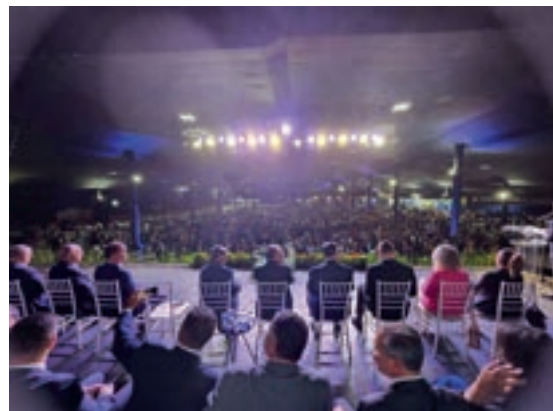
Público lotou evento