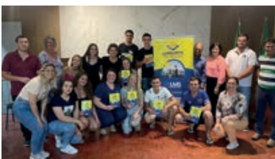
Capitão - Rio Grande do Sul