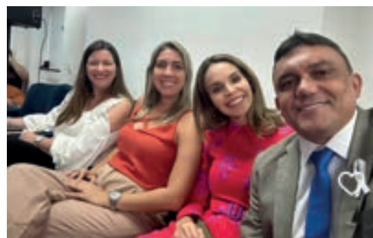
Vereadores e vereadoras lotam as dependências da UVC no encontro estadual em Fortaleza CE

fundamental, um poder independente do Executivo. O vereador deve ter a independência acima do partido, pois, quando eleito tem a obrigação de representar toda comunidade.