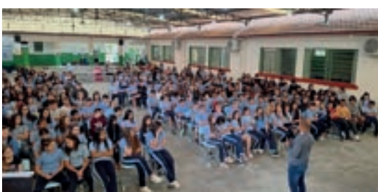
Agrolândia - Santa Catarina