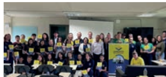
Rancho Queimado - Santa Catarina