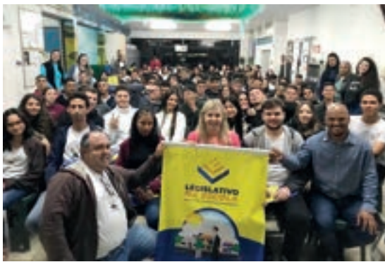
Ivaiporã - Paraná