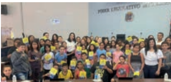
Três Fronteiras - São Paulo