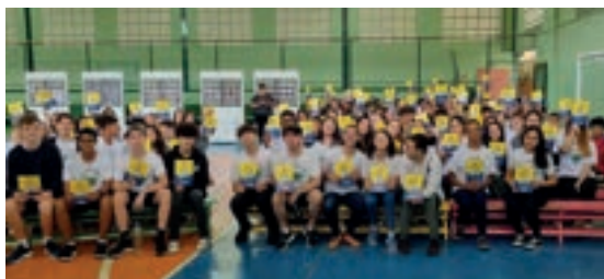
Marechal Floriano - Espírito Santo