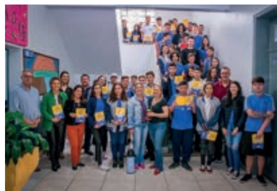
Iraí - Rio Grande do Sul