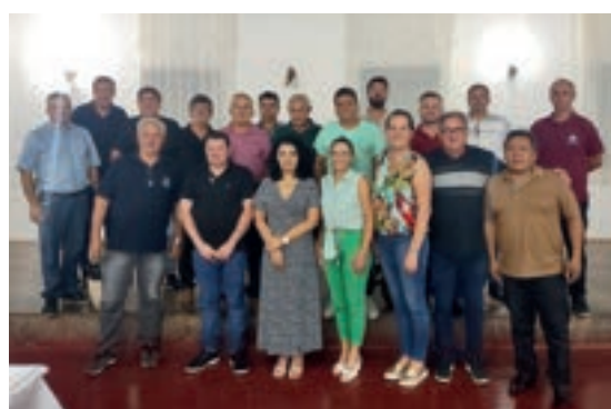
Erval Seco/RS - ACVERMAU reativada elege diretoria

Em reunião realizada em abril na Câmara de Erval Seco/RS, com parlamentares da Região do Médio Alto Uruguai, foi reativada oficialmente a Associação das Câmaras de Vereadores do Médio e Alto Uruguai (ACVERMAU). No en-