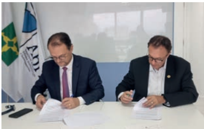
Presidentes da ABRIG e UVB assinam Termo de Cooperação

Com a finalidade de ampliar o relacionamento institucional, pautado pela ética, transparência e debate, a Associação Brasileira de Relações Institucionais e Governamentais – ABRIG e a União dos Vereadores do Brasil – UVB assinaram o acordo de cooperação no dia 26 de março. O acordo tem por objetivo formalizar a aliança estratégica e a união de esforços entre as entidades, buscando o intercâmbio de informações, a cooperação técnica e o permanente diálogo entre seus associados. Com assinatura, a parceria