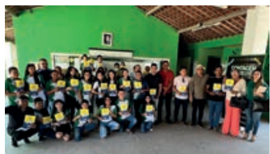
Irauçuba - Ceará