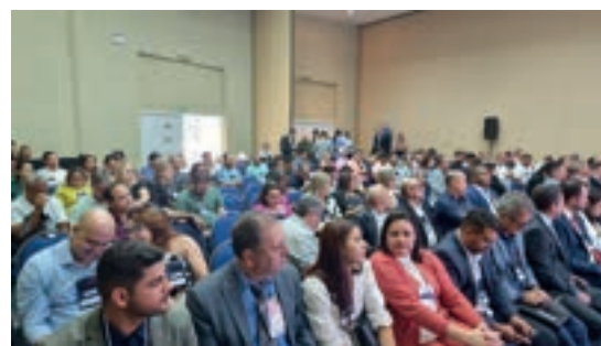
Foz do Iguaçu - PR