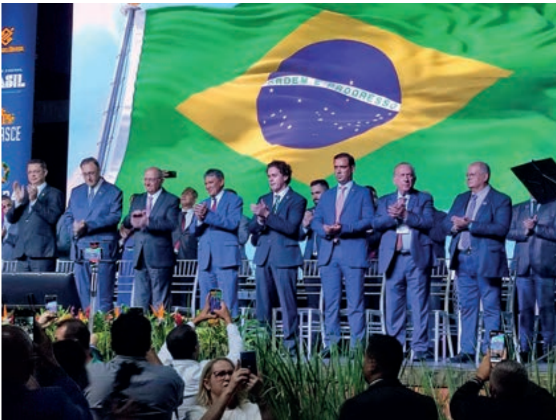
Cerimônia de Abertura da Marcha dos Gestores e Legislativos Municipais 2023

Confira algumas imagens da Marcha de 2023: