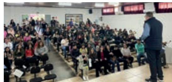
Boa Vista do Ingra - Rio Grande do Sul