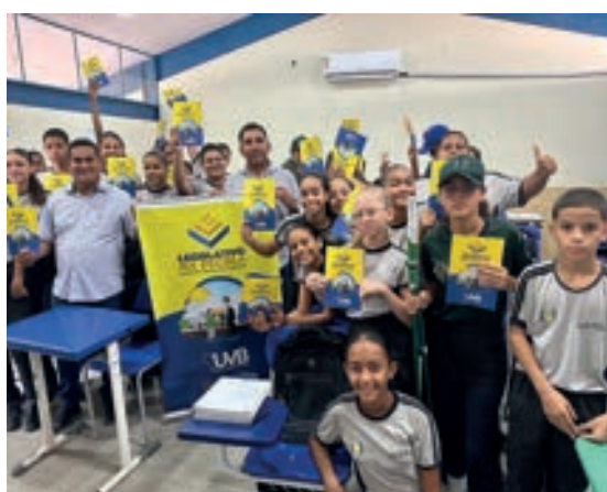
Araguatins - Tocantins