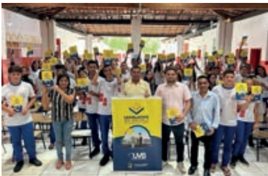
Passagem Franca - Maranhão