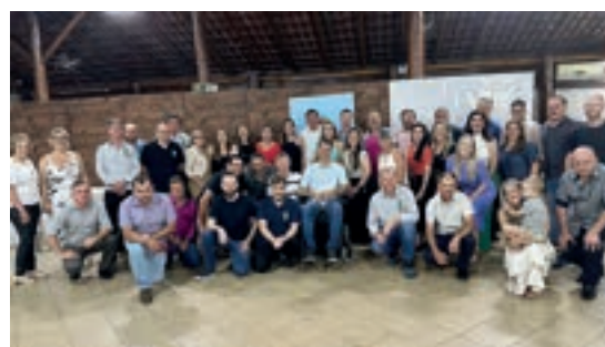
Confraternização AVAT - Cruzeiro do Sul/RS