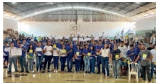
Juara - Mato Grosso