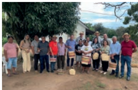
Vereadores visitam aldeia Kaingang em Iraí RS