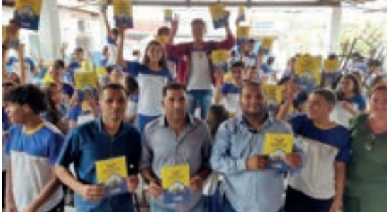
Governador Édison Lobão