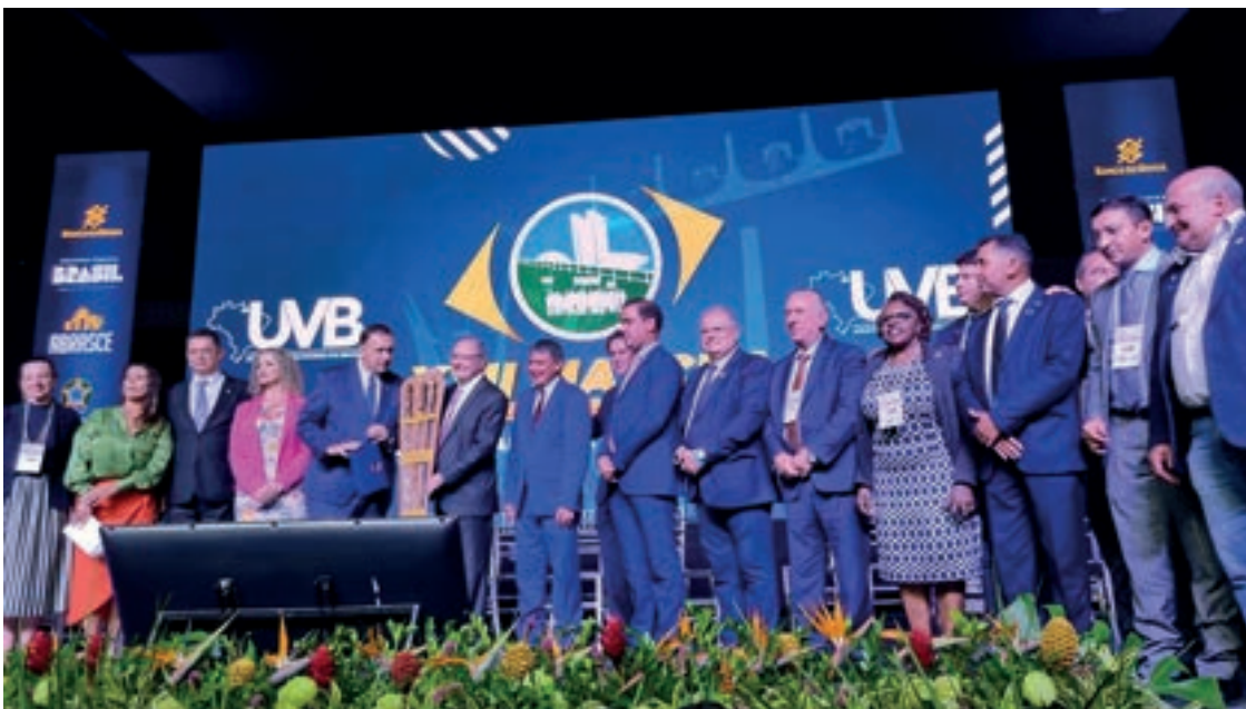
Presidente em Exercício, na época, Geraldo Alckmin recebeu uma homenagem