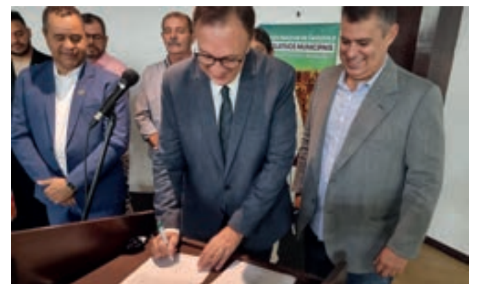
UVB e município de Maceió assinam protocolo de parceria