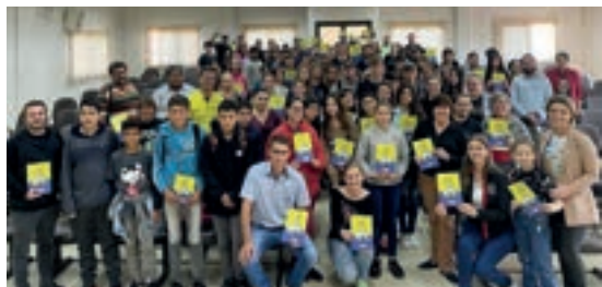
Mato Queimado - Rio Grande do Sul