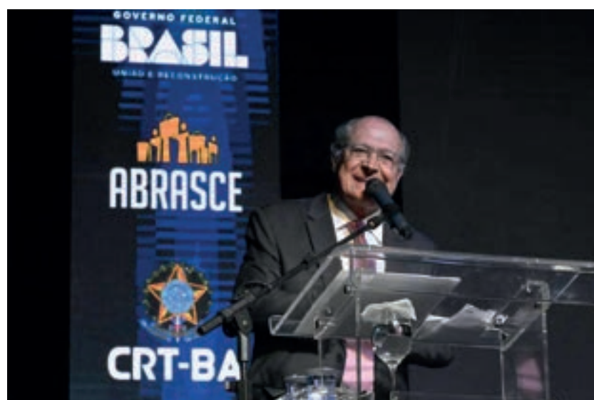
Na Marcha de 2023 Vice presidente Geraldo Alckmin ressaltou a importância das Câmaras de Vereadores

Assim como no ano de 2023, Alckmin deve participar da abertura do evento que acontece em Brasília. Em 2023 o Vice-Presidente falou em seu discurso que o : “Século XXI é “das cidades”. Destacou que a prioridade do Governo Federal era o