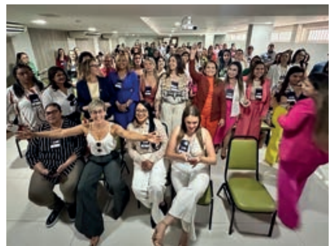
Vereadoras reunidas em João Pessoa, no Fórum da Mulher Parlamentar da UVB